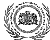
РИСУНОК УДОСТОВЕРЕНИЯ К ПОЧЕТНОМУ ЗНАКУ «ЗА ЗАЩИТУ ПРАВ ЧЕЛОВЕКА В ИВАНОВСКОЙ ОБЛАСТИ»

к приказу Уполномоченного по правам человека в Ивановской области от «01» сентября 2017 года № 20-01/05